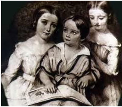
Blandine, Daniel y Cosima, hijos de Liszt

Blandine, Daniel et Cosima Liszt in Memoriam